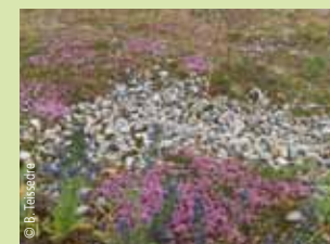
Thym serpolet en fleurs

Au printemps, le paysage se teinte de couleurs chatoyantes. Les minuscules fleurs mauves du Thym serpolet rivalisent avec les pétales jaunes du Pavot cornu, sorte de coquelicot. Rares et fragiles, ces fleurs sont protégées : ne les cueillez pas et ne les piétinez pas.