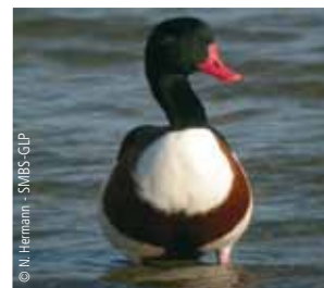
Tadorne de Belon

Plus de 300 espèces d'oiseaux ont été recensées dans la Réserve Naturelle, parmi lesquelles le Tadorne de Belon, le Héron cendré, le Canard siffleur, le Vanneau huppé, le Pluvier argenté, le Chevalier gambette... Les grandes vasières, à forte productivité biologique, la diversité des milieux et la présence de zones humides à proximité sont des arguments essentiels. La Réserve Naturelle de la Baie de Somme abrite également une flore riche et diversifiée. On note la présence de la Parnassie des marais, de l'Elyme des sables et le Chardon des dunes, emblème du Conservatoire du Littoral.